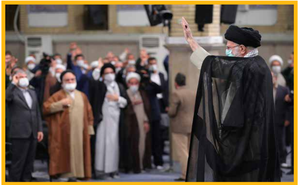
ترند به کار گرفته شده توسط رسانه‌های ضد ایرانی: