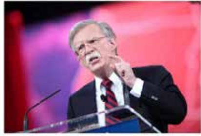
Former US national security advisor