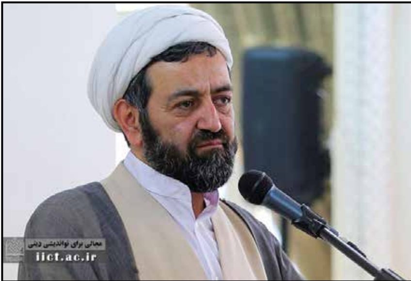
معدنی برای نوادینسی دینی

صرفنظر از همه این امور اکنون با گذشت ۴۵ سال از انقلاب اسلامی ناراستی این ایده در نظر و عمل رنگ باخته و باطل شده است. در حادثه جانسوز اخیر همه شهدا از ریاست‌جمهور عزیز گرفته تا امام جمعه معتبر و مردمی تیریز بعنوان دو نماد شاخص از روحانیان حکومتی و جانفدای رهبری و وزیر خارجه تا استاندار جوان آذربایجان بعنوان دو مسئول غیر روحانی حکومتی و مقلد رهبری تا مأمورین حفاظت و کادر پرواز همه و همه عاملین حکومت و خدمتگزار اسلام سیاسی بودند. تجلیلی که از این عزیزان شهید در استانها و شهرهای مختلف شد بعد از تشییع حضرت امام خمینی(ره) یا بی‌نظیر بوده یا کم‌نظیر؛ پیام این استقبال و تجلیل پیروزی مکرر اسلام سیاسی و روحانیت سیاسی و شکست ایده جدایی دین از سیاست و شکست ایده جدایی روحانیت از سیاست است. ثابت شد مردم اگر از مسئولین