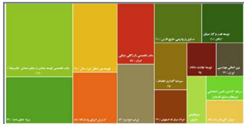
تسهیلات گیرندگان بزرگ شبکه بانکی (هزار میلیارد تومان)

بررسی اطلاعات منتشر شده مطابق با مصوبه مجلس در خصوص شفافیت تسهیلات کلان و اشخاص مرتبط بانکی